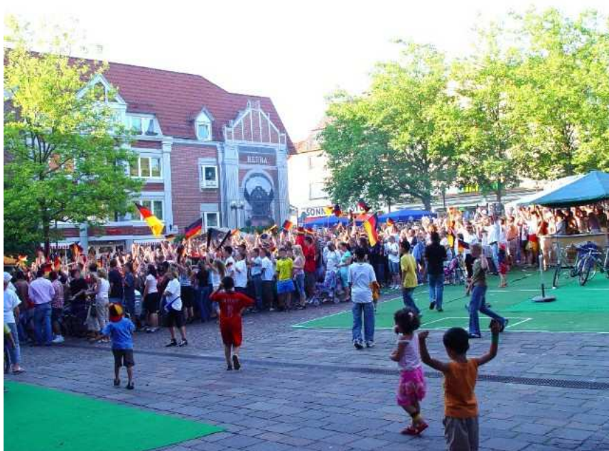
Фото 2. Телевизионные болельщики на городской площади

На этот раз я решил собственными глазами посмотреть на футбольный феномен. И я увидел, что власти города не ограничились только установкой большого экрана на площади, но ещё дополнительно привлекли организатора, который управлял толпой.