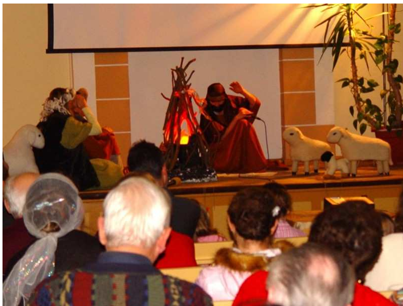
Фото 4. Рождественское богослужение в церкви

Вот впечатления о рождественском богослужении членов этой церкви: