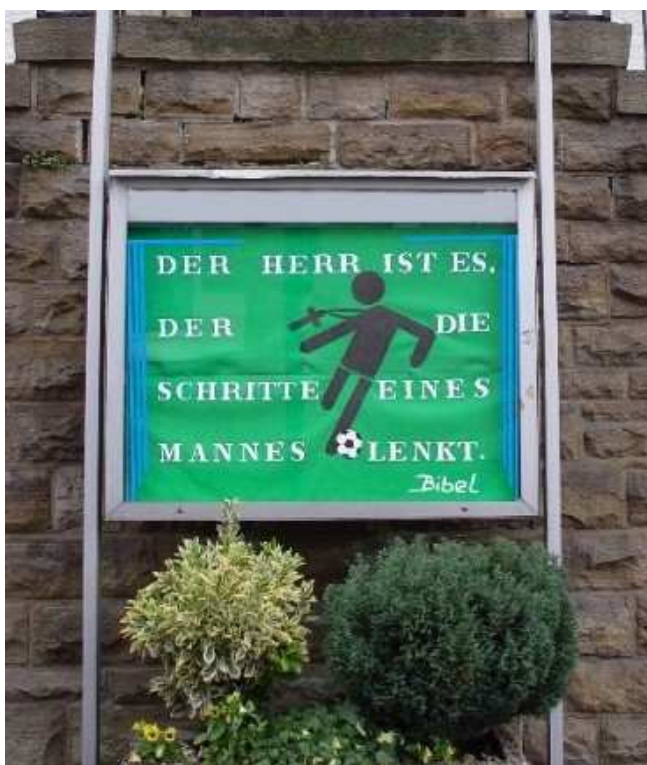
Фото 3. Церковный плакат к чемпионату мира по футболу

На церковном плакате изображен бегущий футболист, на шее у которого на длинном шнурке болтается, как свисток, крест.